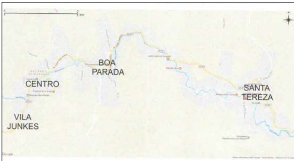
Figura 1- Localização dos sistemas de abastecimento de água no município de São Pedro de Alcântara

Cada um desses sistemas possui diferentes formas de captação de água (água bruta) de uma fonte superficial. Após captada, a água bruta passa, em seguida, por um processo de remoção de sólidos grosseiros por gradeamento, decantação, filtragem e desinfecção por cloração das águas, fluoretação e assim é reservada e distribuída para a população (água tratada). Nos próximos subitens serão apresentadas as características de cada um dos sistemas.