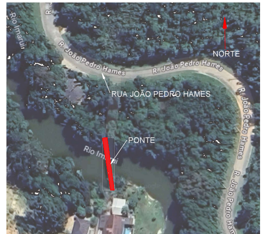
PLANTA DE SITUAÇÃO E LOCALIZAÇÃO ESCALA 1:500