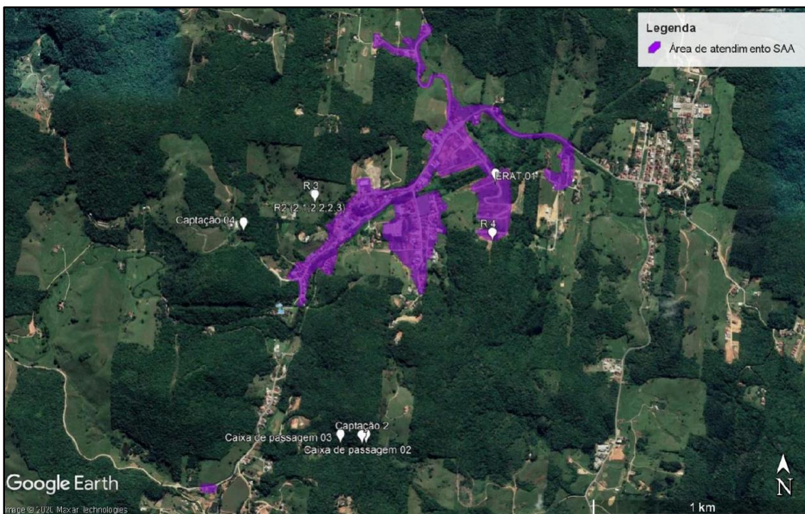
Figura 2- Área que abrangem o reservatório do centro

O abastecimento do SAA Centro (Figura 2) ocorre por meio de 3 (três) captações: 4 (quatro) caixas de passagem para retenção de sólidos e 5 (cinco) reservatórios, com armazenamento total de aproximadamente 160.000 L. Além disso, o SAA Centro possui uma estação de recalque de água tratada instalada no Loteamento São Pedro, com dois conjuntos de moto bombas de 5 HP. Estima-se uma extensão de rede por volta de 12.128 metros, considerando adução e distribuição.