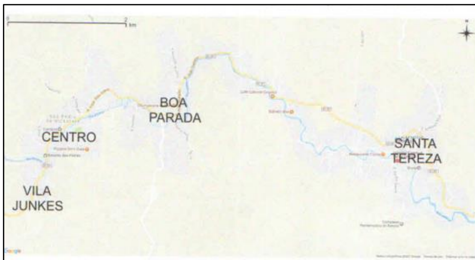
Figura 1- Localização dos sistemas de abastecimento de água no município de São Pedro de Alcântara

Cada um desses sistemas possui diferentes formas de captação de água (água bruta) de uma fonte superficial. Após captada, a água bruta passa, em seguida, por um processo de remoção de sólidos grosseiros por gradeamento, decantação, filtragem e desinfecção por cloração das águas, florestação e assim é reservada e distribuída para a população (água tratada).