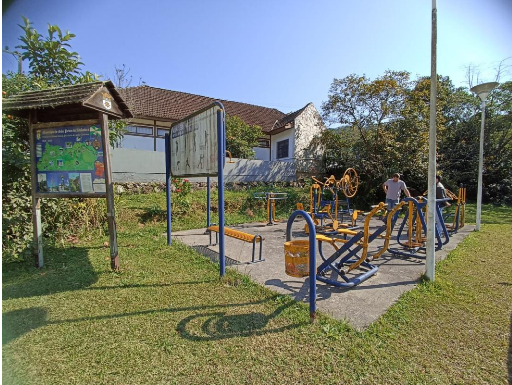
Figura 30 Academia

Academia ao ar livre da marca Ziober do Brasil, equipamentos necessitam de pintura, reparo de pontos de ferrugem, lubrificação de rolamentos, troca de alguns parafusos. É necessário inclusão de placa de orientação quanto aos exercícios.