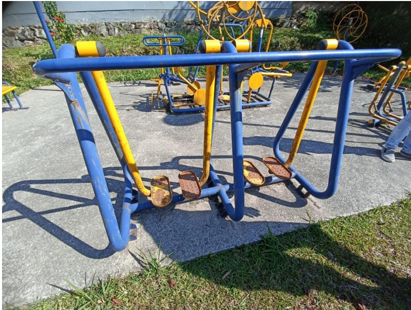
Figura 34 Equipamento com necessidade de pintura manutenção

ESTADO DE SANTA CATARINA MUNICÍPIO DE SÃO PEDRO DE ALCÂNTARA SECRETARIA MUNICIPAL DE TRIBUTAÇÃO E FISCALIZAÇÃO Praça Leopoldo Francisco Kretzer, 01- Centro - 88125-000 Fone (48) 3277-0122 www.pmspa.sc.gov.br / tributos@pmspa.sc.gov.br