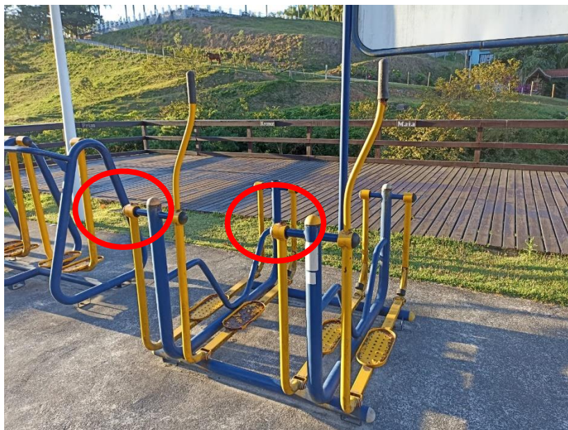
Figura 28 Equipamento com necessidade de pintura e manutenção e troca de peças danificadas

ESTADO DE SANTA CATARINA MUNICÍPIO DE SÃO PEDRO DE ALCÂNTARA SECRETARIA MUNICIPAL DE TRIBUTAÇÃO E FISCALIZAÇÃO Praça Leopoldo Francisco Kretzer, 01- Centro - 88125-000 Fone (48) 3277-0122 www.pmspa.sc.gov.br / tributos@pmspa.sc.gov.br