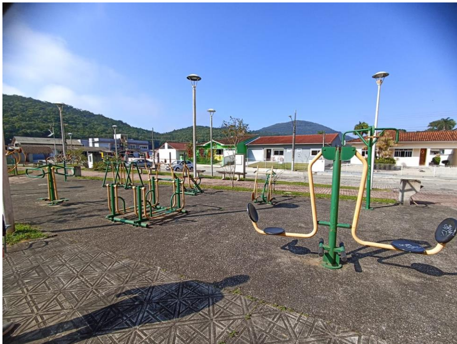
Figura 1 Academia Completa

Academia ao ar livre da marca Santana Fitness, equipamentos necessitam de pintura, reparo de pontos de ferrugem, lubrificação de rolamentos, troca de alguns parafusos e reparos em equipamentos danificados. É necessário inclusão de placa de orientação quanto aos exercícios.