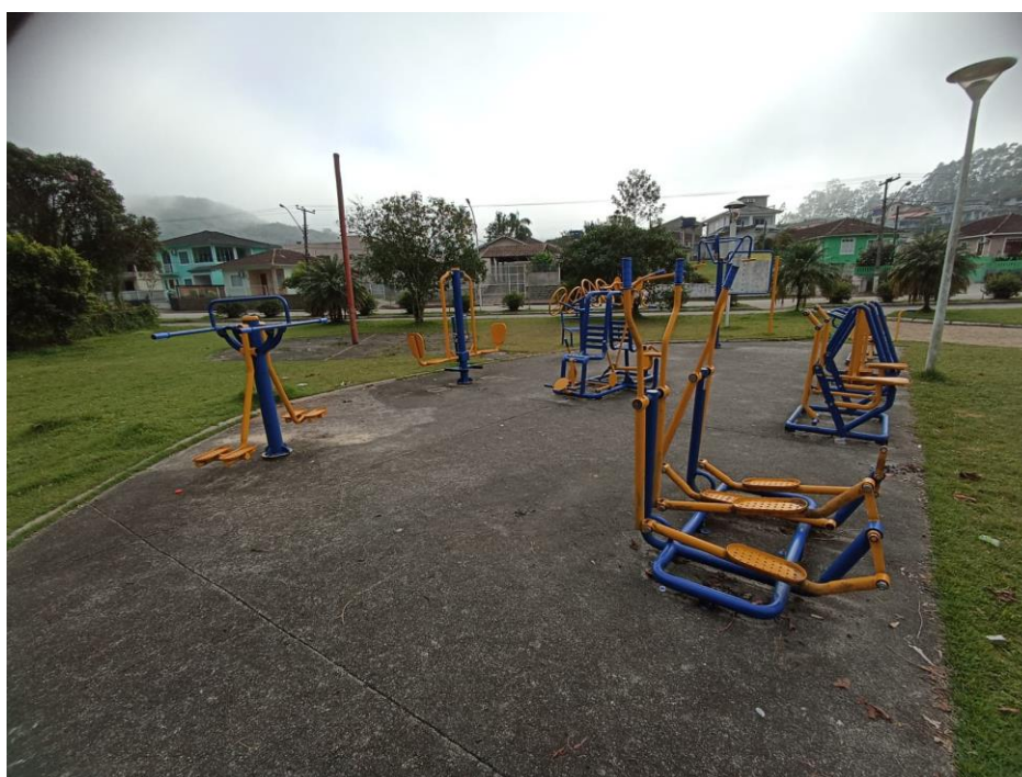
Figura 45 Academia