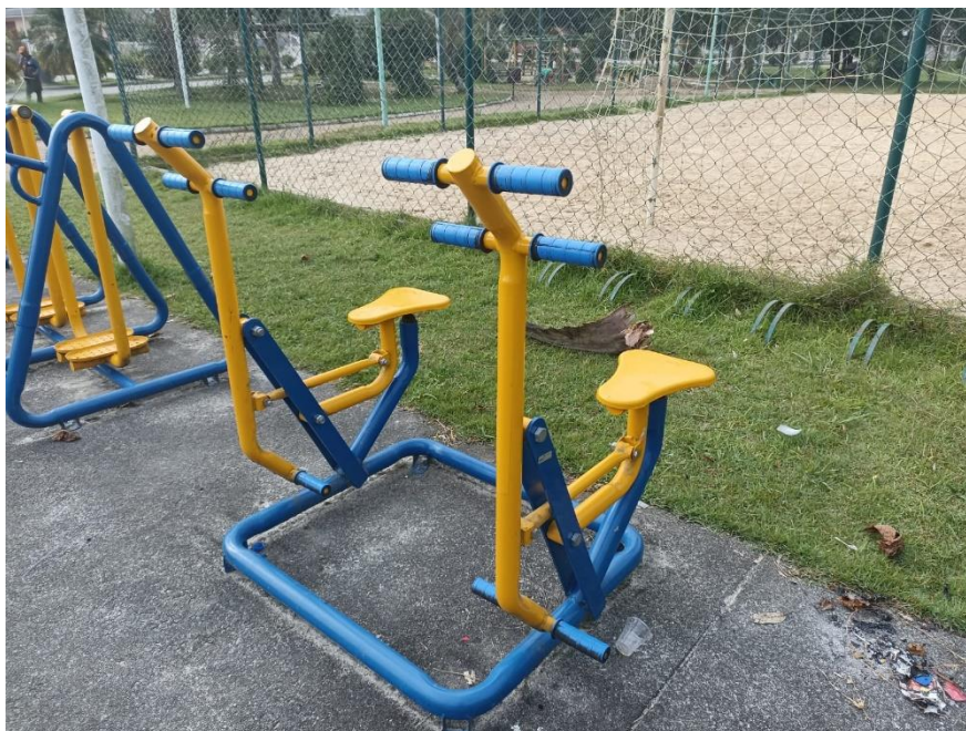
Figura 47 Equipamento com necessidade de pintura e manutenção