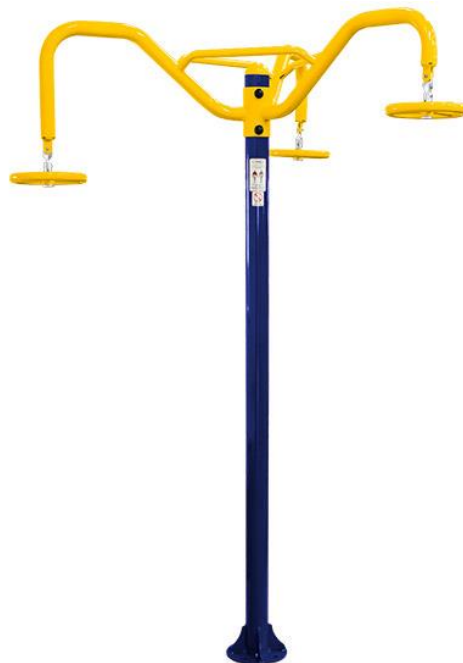
Figura 37 Equipamento