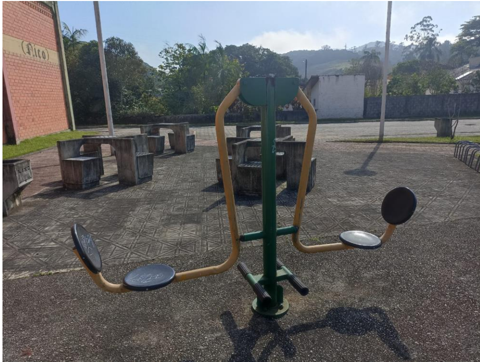
Figura 12 Equipamento com necessidade de pintura e manutenção.

ESTADO DE SANTA CATARINA MUNICÍPIO DE SÃO PEDRO DE ALCÂNTARA SECRETARIA MUNICIPAL DE TRIBUTAÇÃO E FISCALIZAÇÃO Praça Leopoldo Francisco Kretzer, 01- Centro - 88125-000 Fone (48) 3277-0122 www.pmspa.sc.gov.br / tributos@pmspa.sc.gov.br