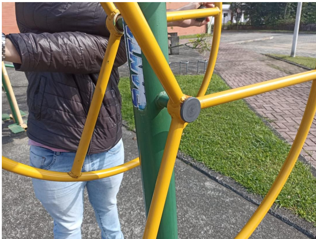
Figura 5 Equipamento com necessidade de pintura e manutenção.

ESTADO DE SANTA CATARINA MUNICÍPIO DE SÃO PEDRO DE ALCÂNTARA SECRETARIA MUNICIPAL DE TRIBUTAÇÃO E FISCALIZAÇÃO Praça Leopoldo Francisco Kretzer, 01- Centro - 88125-000 Fone (48) 3277-0122 www.pmspa.sc.gov.br / tributos@pmspa.sc.gov.br