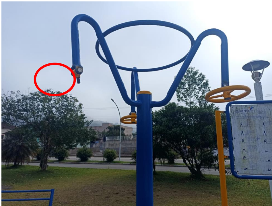
Figura 41 Equipamento com necessidade de pintura e manutenção e troca de peças danificadas