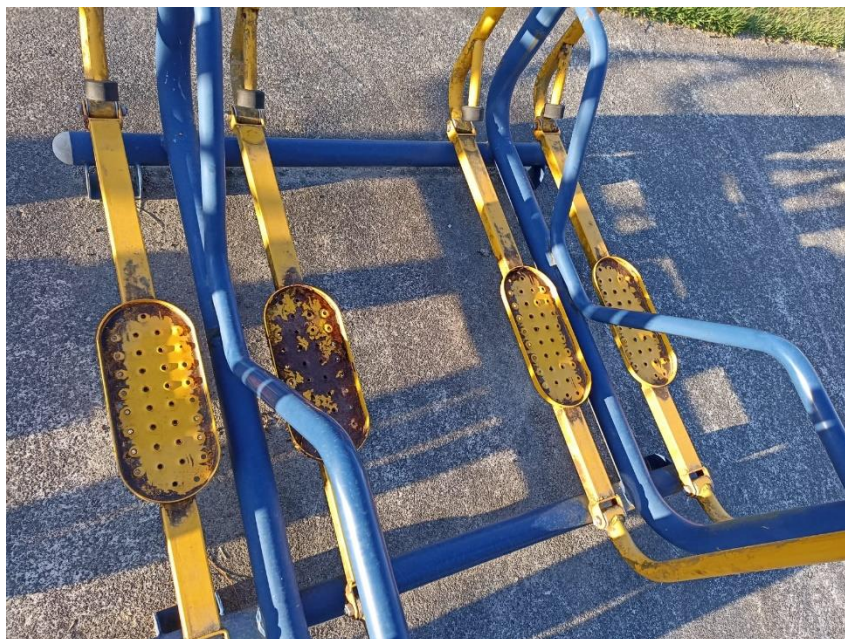
Figura 24 Equipamento com necessidade de pintura e manutenção

ESTADO DE SANTA CATARINA MUNICÍPIO DE SÃO PEDRO DE ALCÂNTARA SECRETARIA MUNICIPAL DE TRIBUTAÇÃO E FISCALIZAÇÃO Praça Leopoldo Francisco Kretzer, 01 - Centro - 88125-000 Fone (48) 3277-0122 www.pmspa.sc.gov.br / tributos@pmspa.sc.gov.br