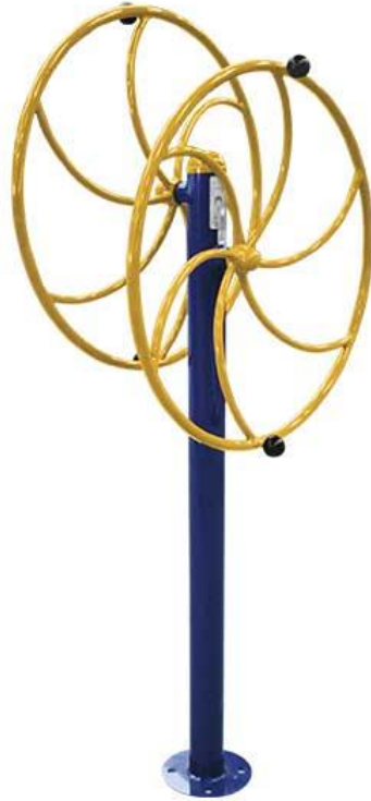
Figura 38 Equipamento

ESTADO DE SANTA CATARINA MUNICÍPIO DE SÃO PEDRO DE ALCÂNTARA SECRETARIA MUNICIPAL DE TRIBUTAÇÃO E FISCALIZAÇÃO Praça Leopoldo Francisco Kretzer, 01- Centro - 88125-000 Fone (48) 3277-0122 www.pmspa.sc.gov.br / tributos@pmspa.sc.gov.br