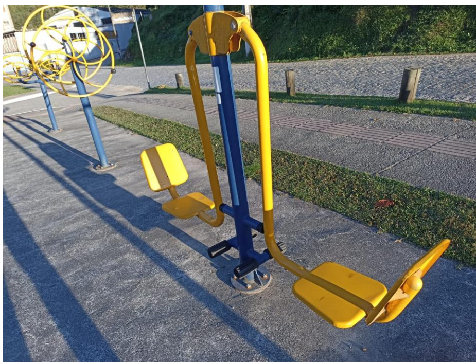
Figura 23 Equipamento com necessidade de pintura e manutenção