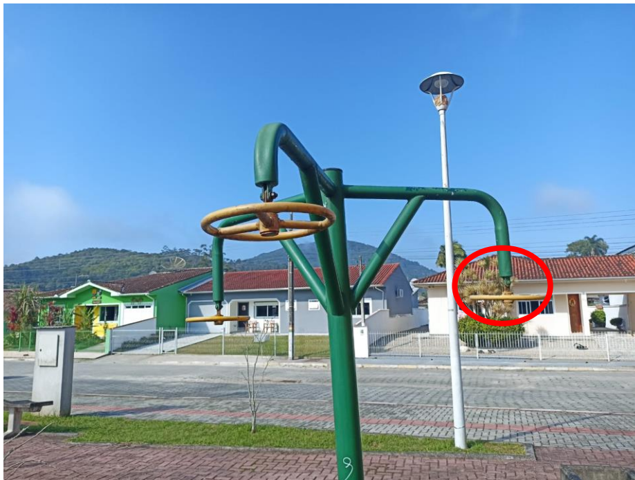
Figura 9 Equipamento com necessidade de pintura, manutenção e reposição de peças.