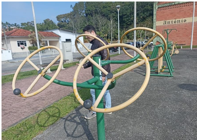
Figura 2: Equipamento com necessidade de pintura e manutenção.