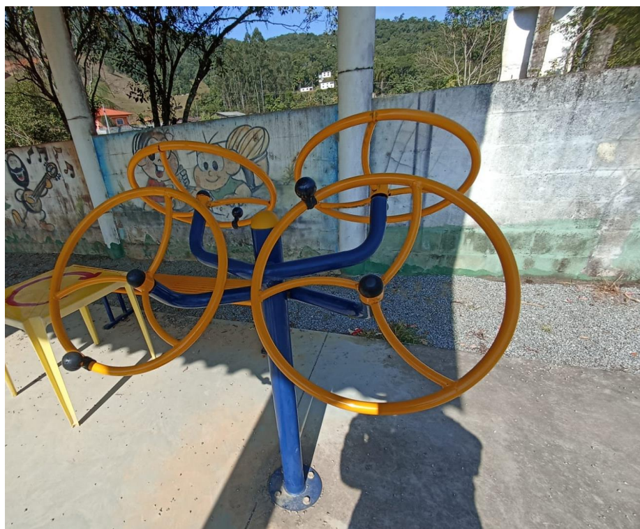
Figura 18 Equipamento com necessidade de manutenção