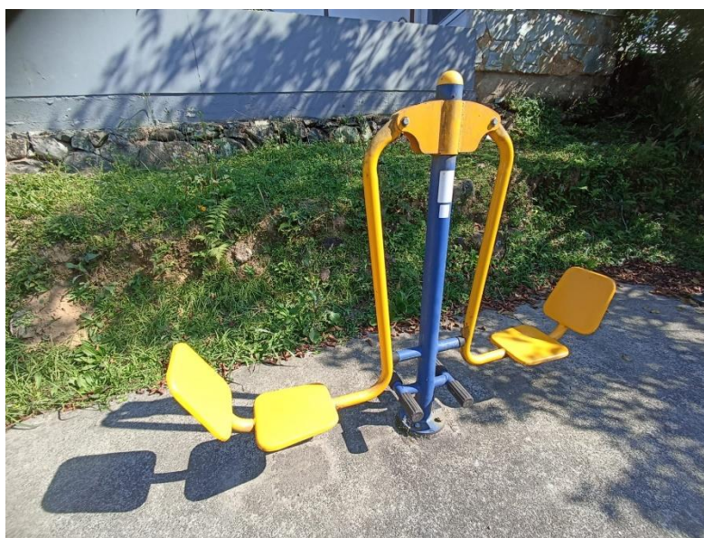
Figura 33 Equipamento com necessidade de pintura e manutenção