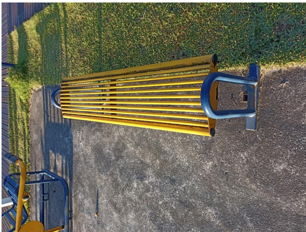
Figura 29 Banco com necessidade de pintura e manutenção