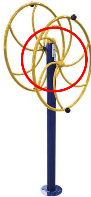
Figura 50 Equipamento Estragado

ESTADO DE SANTA CATARINA MUNICÍPIO DE SÃO PEDRO DE ALCÂNTARA SECRETARIA MUNICIPAL DE TRIBUTAÇÃO E FISCALIZAÇÃO Praça Leopoldo Francisco Kretzer, 01- Centro - 88125-000 Fone (48) 3277-0122 www.pmspa.sc.gov.br / tributos@pmspa.sc.gov.br