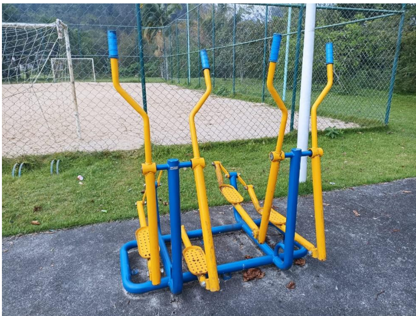
Figura 46 Equipamento com necessidade de pintura e manutenção e troca de peças danificadas

ESTADO DE SANTA CATARINA MUNICÍPIO DE SÃO PEDRO DE ALCÂNTARA SECRETARIA MUNICIPAL DE TRIBUTAÇÃO E FISCALIZAÇÃO Praça Leopoldo Francisco Kretzer, 01- Centro - 88125-000 Fone (48) 3277-0122 www.pmspa.sc.gov.br / tributos@pmspa.sc.gov.br