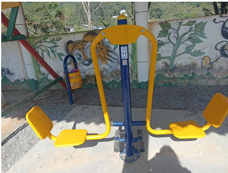
Figura 16 Equipamento com necessidade de manutenção

ESTADO DE SANTA CATARINA MUNICÍPIO DE SÃO PEDRO DE ALCÂNTARA SECRETARIA MUNICIPAL DE TRIBUTAÇÃO E FISCALIZAÇÃO Praça Leopoldo Francisco Kretzer, 01- Centro - 88125-000 Fone (48) 3277-0122 www.pmspa.sc.gov.br / tributos@pmspa.sc.gov.br