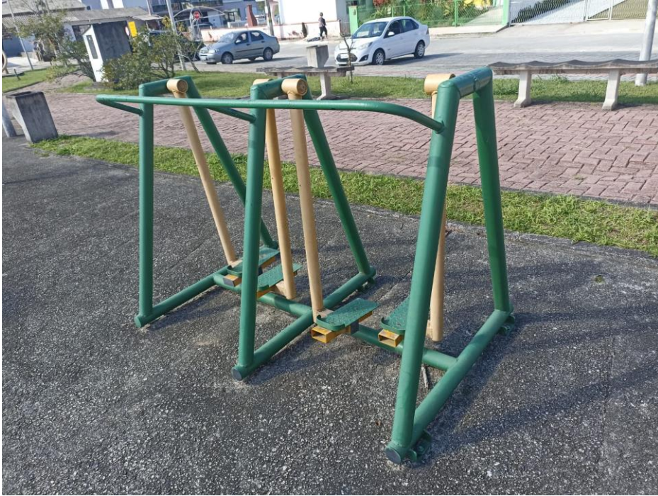
Figura 10 Equipamento com necessidade de pintura e manutenção.

ESTADO DE SANTA CATARINA MUNICÍPIO DE SÃO PEDRO DE ALCÂNTARA SECRETARIA MUNICIPAL DE TRIBUTAÇÃO E FISCALIZAÇÃO Praça Leopoldo Francisco Kretzer, 01- Centro - 88125-000 Fone (48) 3277-0122 www.pmspa.sc.gov.br / tributos@pmspa.sc.gov.br