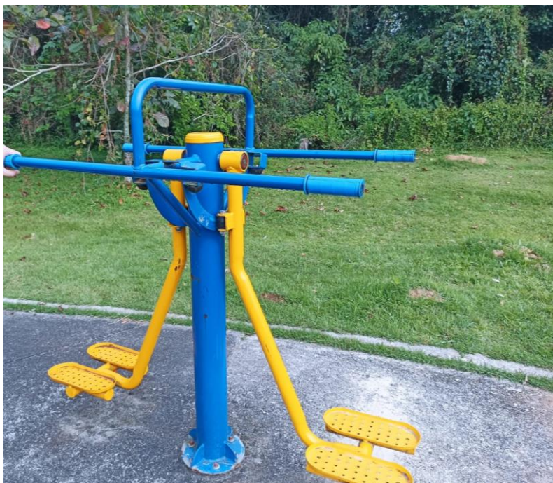
Figura 48 Equipamento com necessidade de pintura e manutenção

ESTADO DE SANTA CATARINA MUNICÍPIO DE SÃO PEDRO DE ALCÂNTARA SECRETARIA MUNICIPAL DE TRIBUTAÇÃO E FISCALIZAÇÃO Praça Leopoldo Francisco Kretzer, 01- Centro - 88125-000 Fone (48) 3277-0122 www.pmspa.sc.gov.br / tributos@pmspa.sc.gov.br