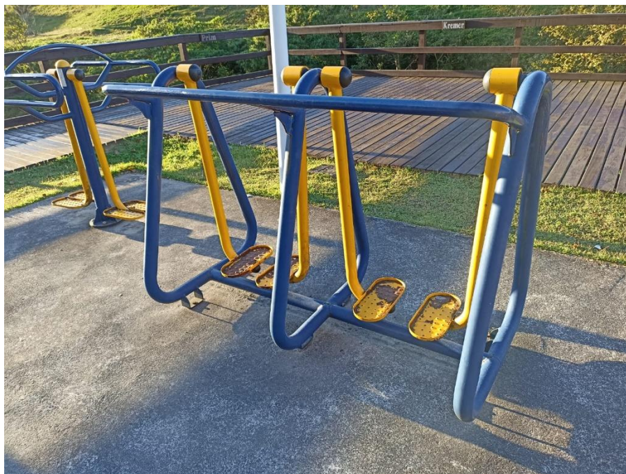
Figura 21 Equipamento com necessidade de pintura e manutenção