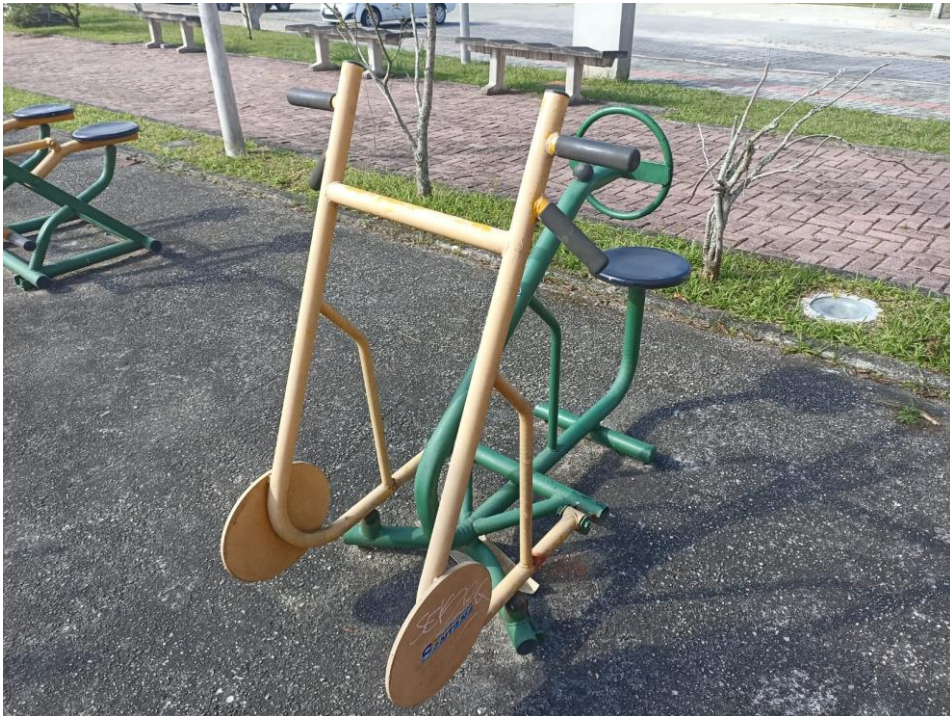
Figura 11 Equipamento com necessidade de pintura e manutenção.