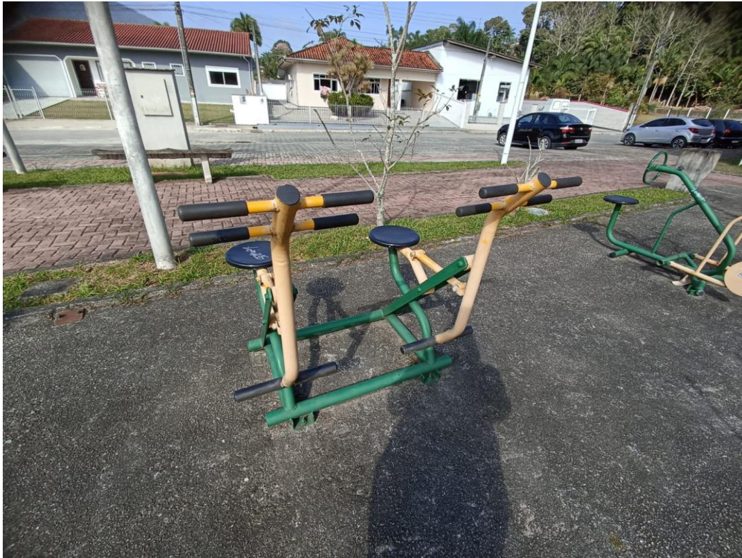
Figura 6 Equipamento com necessidade de pintura e manutenção.

ESTADO DE SANTA CATARINA MUNICÍPIO DE SÃO PEDRO DE ALCÂNTARA SECRETARIA MUNICIPAL DE TRIBUTAÇÃO E FISCALIZAÇÃO Praça Leopoldo Francisco Kretzer, 01- Centro - 88125-000 Fone (48) 3277-0122 www.pmspa.sc.gov.br / tributos@pmspa.sc.gov.br