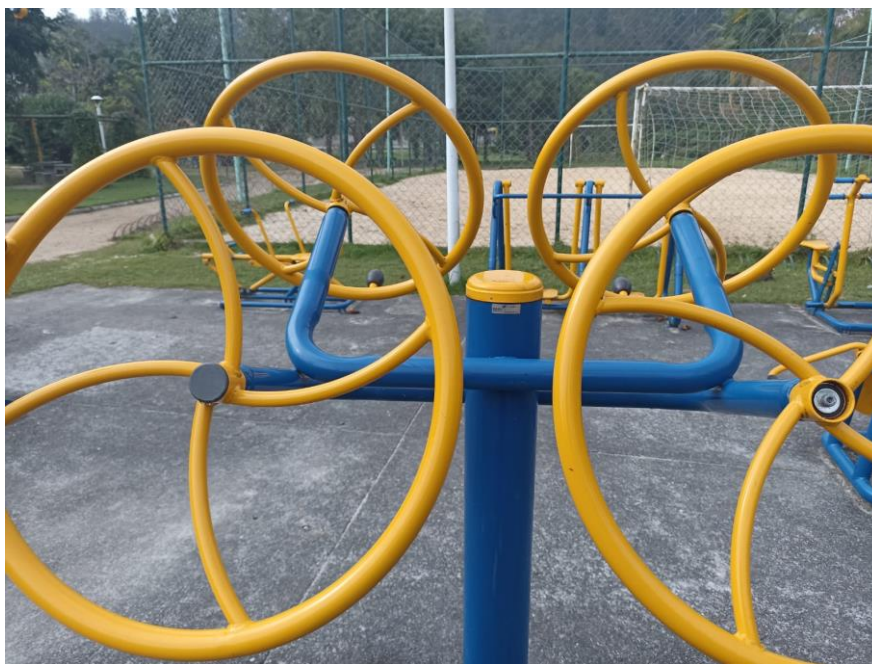
Figura 43 Equipamento com necessidade de pintura e manutenção