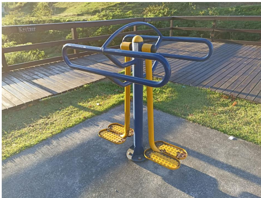
Figura 22 Equipamento com necessidade de pintura e manutenção

ESTADO DE SANTA CATARINA MUNICÍPIO DE SÃO PEDRO DE ALCÂNTARA SECRETARIA MUNICIPAL DE TRIBUTAÇÃO E FISCALIZAÇÃO Praça Leopoldo Francisco Kretzer, 01- Centro - 88125-000 Fone (48) 3277-0122 www.pmspa.sc.gov.br / tributos@pmspa.sc.gov.br