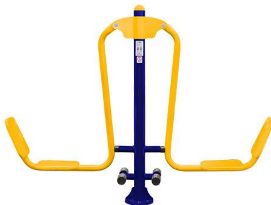
Figura 49 Equipamento