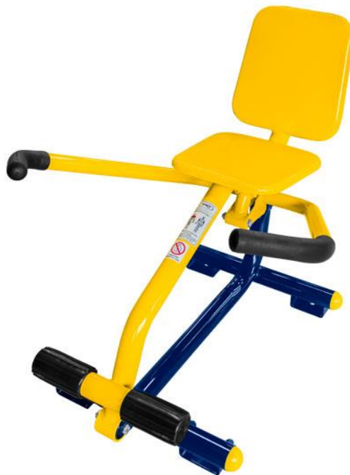
Figura 39 Equipamento