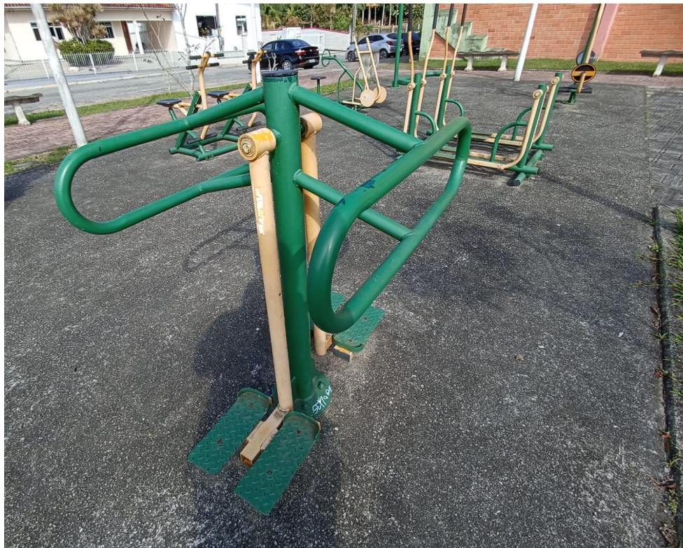
Figura 7 Equipamento com necessidade de pintura e manutenção.