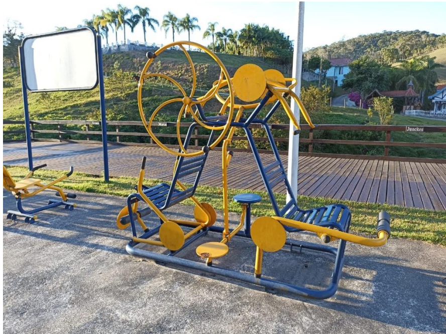
Figura 27 Equipamento com necessidade de pintura e manutenção