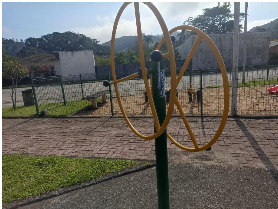
Figura 3 Equipamento com necessidade de pintura e manutenção.

ESTADO DE SANTA CATARINA MUNICIPIO DE SÃO PEDRO DE ALCÂNTARA SECRETARIA MUNICIPAL DE TRIBUTAÇÃO E FISCALIZAÇÃO Praça Leopoldo Francisco Kretzer, 01- Centro - 88125-000 Fone (48) 3277-0122 www.pmspa.sc.gov.br / tributos@pmspa.sc.gov.br