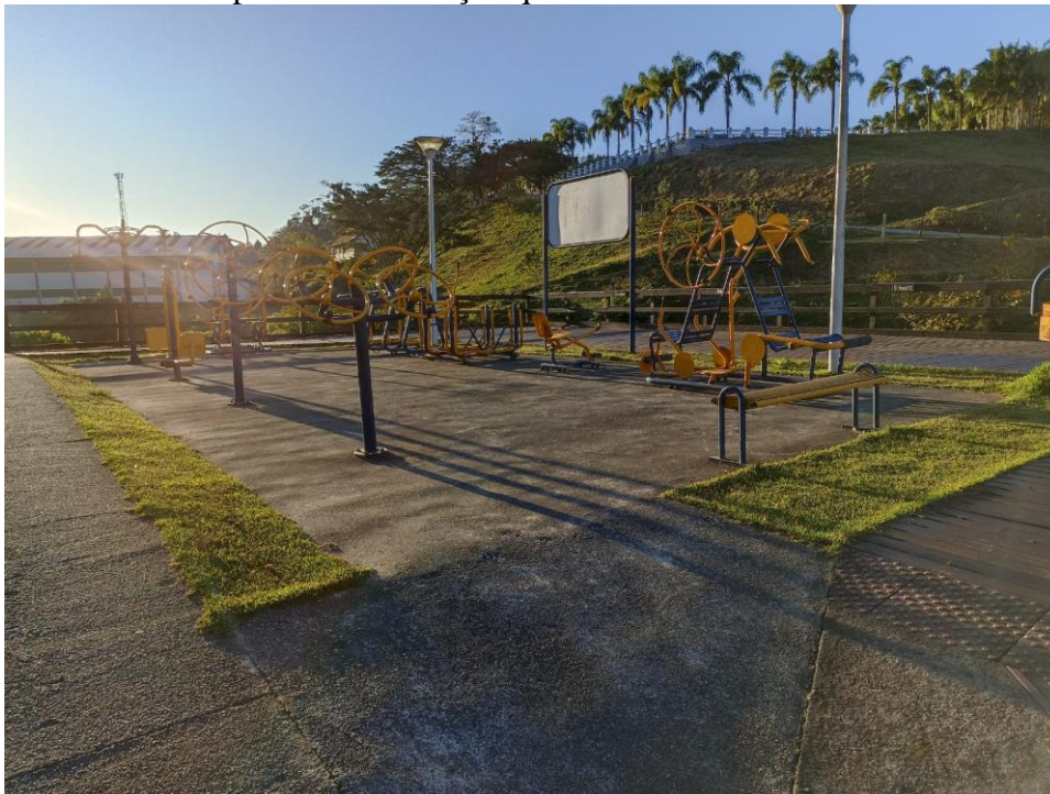
Figura 20 Academia

Academia ao ar livre da marca Ziober do Brasil, equipamentos necessitam de pintura, reparo de pontos de ferrugem, lubrificação de rolamentos, troca de alguns parafusos. É necessário inclusão de placa de orientação quanto aos exercícios.