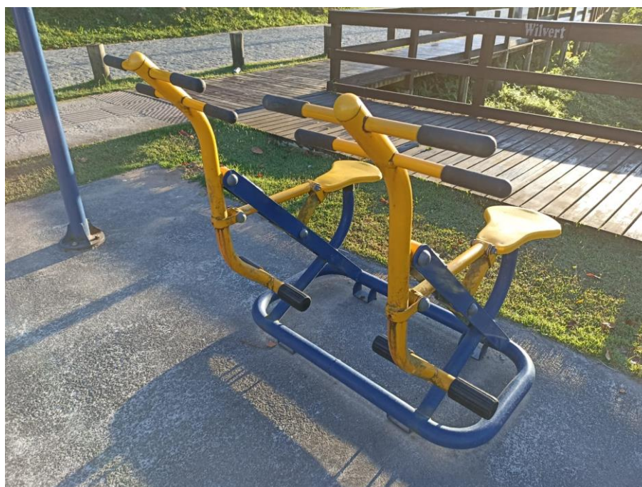
Figura 25 Equipamento com necessidade de pintura e manutenção