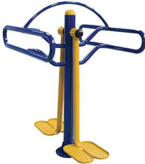
Figura 36 Equipamento

ESTADO DE SANTA CATARINA MUNICÍPIO DE SÃO PEDRO DE ALCÂNTARA SECRETARIA MUNICIPAL DE TRIBUTAÇÃO E FISCALIZAÇÃO Praça Leopoldo Francisco Kretzer, 01- Centro - 88125-000 Fone (48) 3277-0122 www.pmspa.sc.gov.br / tributos@pmspa.sc.gov.br