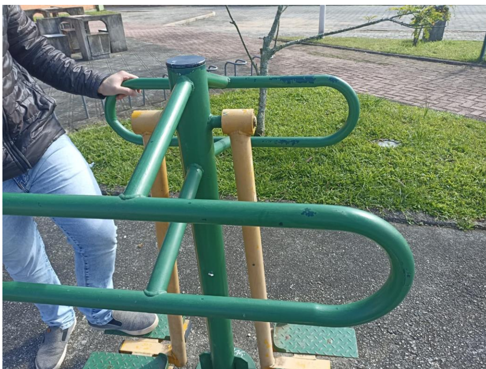
Figura 4 Equipamento com necessidade de pintura e manutenção.