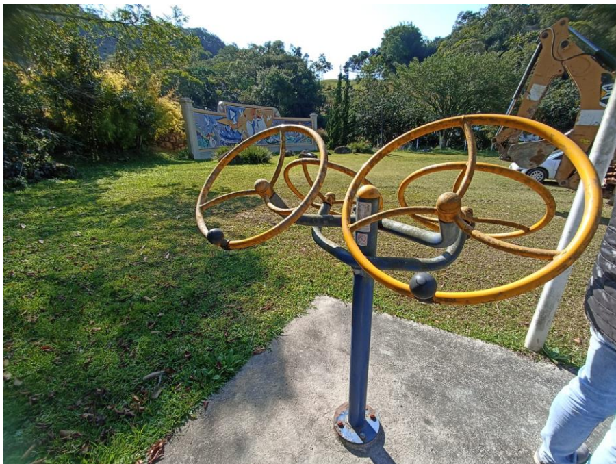
Figura 32 Equipamento com necessidade de pintura e manutenção

ESTADO DE SANTA CATARINA MUNICÍPIO DE SÃO PEDRO DE ALCÂNTARA SECRETARIA MUNICIPAL DE TRIBUTAÇÃO E FISCALIZAÇÃO Praça Leopoldo Francisco Kretzer, 01- Centro - 88125-000 Fone (48) 3277-0122 www.pmspa.sc.gov.br / tributos@pmspa.sc.gov.br