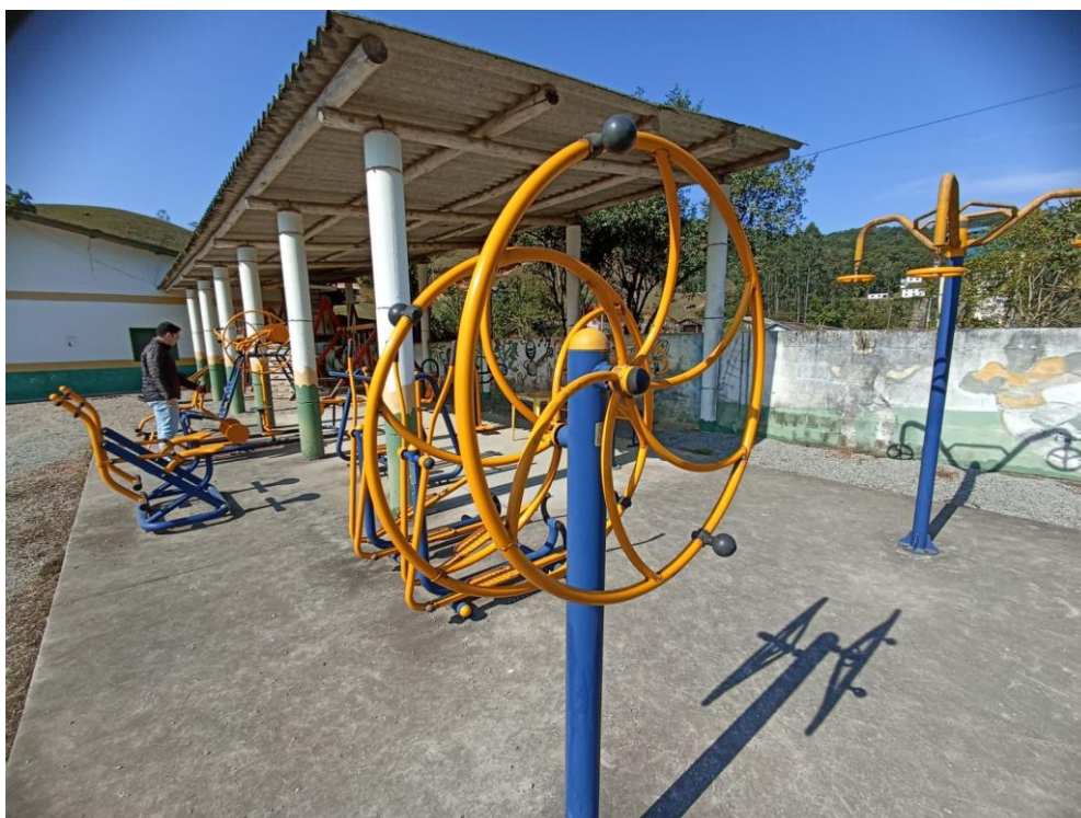
Figura 15 Equipamento com necessidade de manutenção