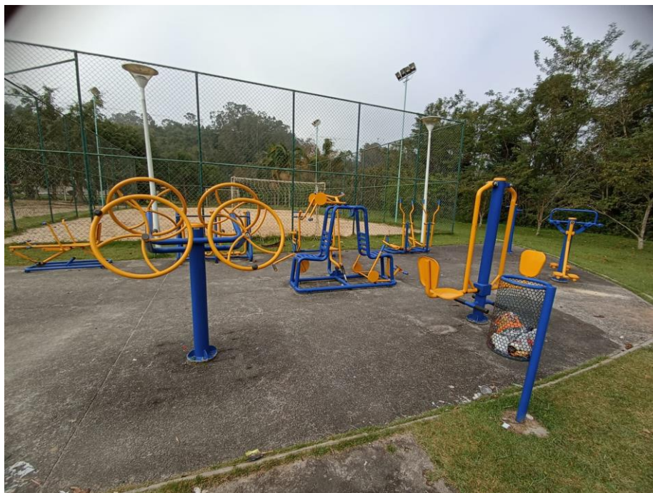
Figura 44 Academia

ESTADO DE SANTA CATARINA MUNICÍPIO DE SÃO PEDRO DE ALCÂNTARA SECRETARIA MUNICIPAL DE TRIBUTAÇÃO E FISCALIZAÇÃO Praça Leopoldo Francisco Kretzer, 01- Centro - 88125-000 Fone (48) 3277-0122 www.pmspa.sc.gov.br / tributos@pmspa.sc.gov.br