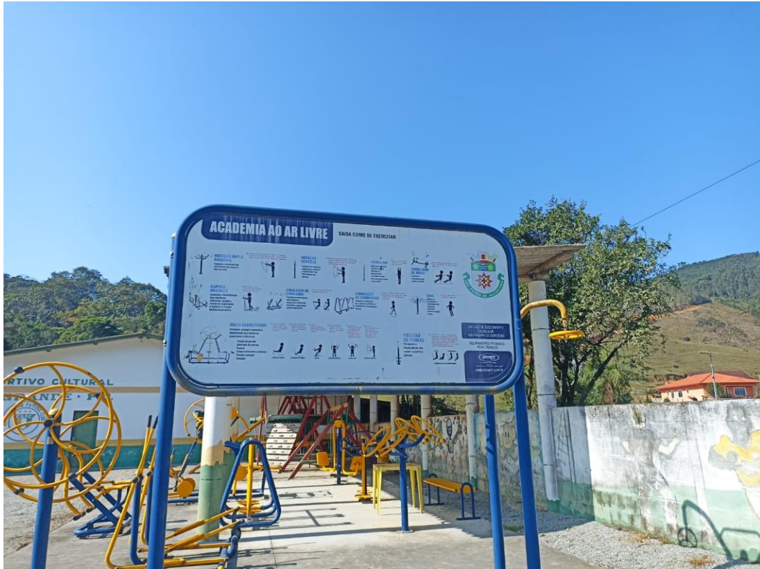
Figura 13: Academia e placa

Academia ao ar livre da marca Ziober do Brasil, equipamentos necessitam de pintura, reparo de pontos de ferrugem, lubrificação de rolamentos, troca de alguns parafusos. É necessário inclusão de placa de orientação quanto aos exercícios.