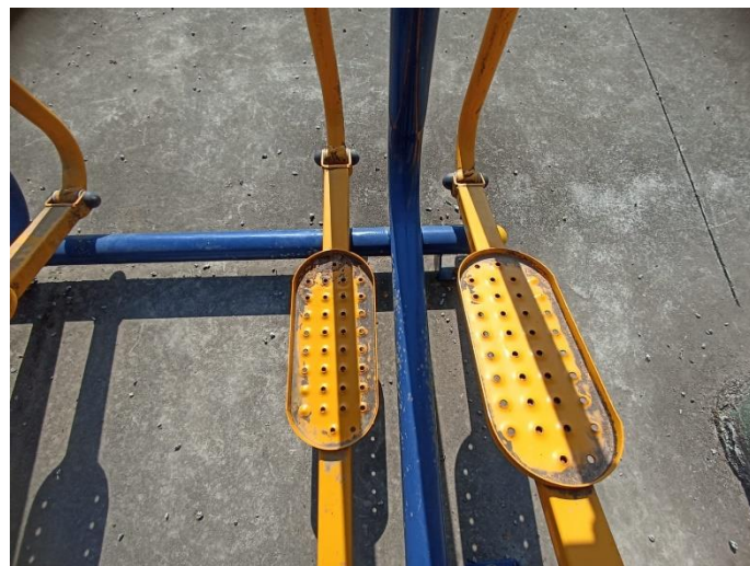
Figura 19 Equipamento com necessidade de pintura e manutenção