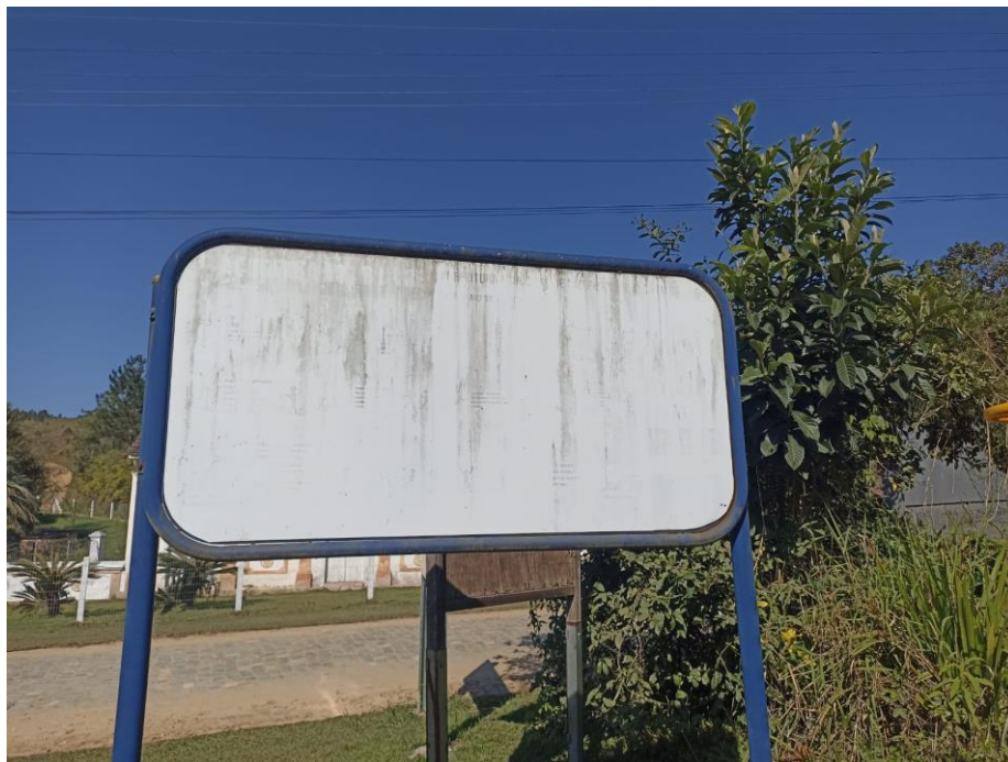
Figura 35 Placa para ser substituída