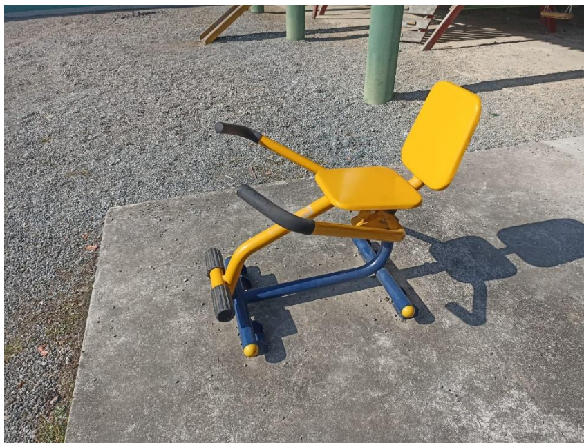
Figura 17 Equipamento com necessidade de manutenção

ESTADO DE SANTA CATARINA MUNICÍPIO DE SÃO PEDRO DE ALCÂNTARA SECRETARIA MUNICIPAL DE TRIBUTAÇÃO E FISCALIZAÇÃO Praça Leopoldo Francisco Kretzer, 01 - Centro - 88125-000 Fone (48) 3277-0122 www.pmspa.sc.gov.br / tributos@pmspa.sc.gov.br