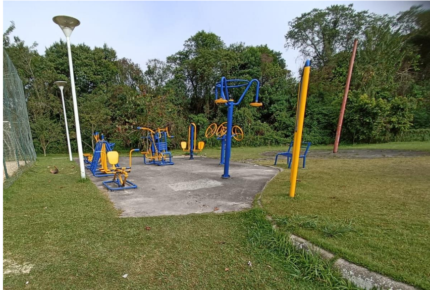
Figura 40 Academia

Academia ao ar livre da marca Askein, equipamentos necessitam de pintura, reparo de pontos de ferrugem, lubrificação de rolamentos, troca de alguns parafusos. É necessário inclusão de placa de orientação quanto aos exercícios.