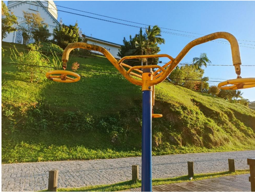
Figura 26 Equipamento com necessidade de pintura e manutenção

ESTADO DE SANTA CATARINA MUNICÍPIO DE SÃO PEDRO DE ALCÂNTARA SECRETARIA MUNICIPAL DE TRIBUTAÇÃO E FISCALIZAÇÃO Praça Leopoldo Francisco Kretzer, 01- Centro - 88125-000 Fone (48) 3277-0122 www.pmspa.sc.gov.br / tributos@pmspa.sc.gov.br