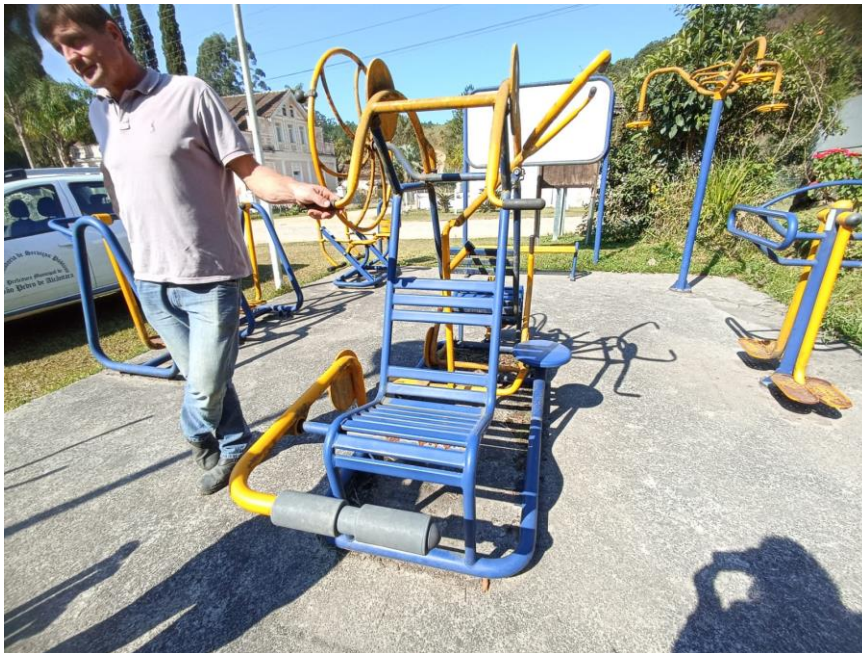
Figura 31 Equipamento com necessidade de pintura e manutenção