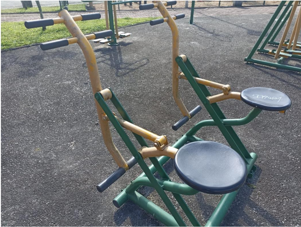
Figura 8 Equipamento com necessidade de pintura e manutenção.

ESTADO DE SANTA CATARINA MUNICÍPIO DE SÃO PEDRO DE ALCÂNTARA SECRETARIA MUNICIPAL DE TRIBUTAÇÃO E FISCALIZAÇÃO Praça Leopoldo Francisco Kretzer, 01- Centro - 88125-000 Fone (48) 3277-0122 www.pmspa.sc.gov.br / tributos@pmspa.sc.gov.br